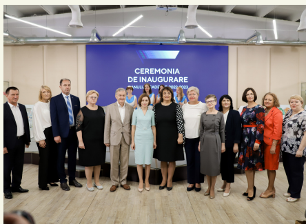
Inaugurarea anului academic 2022-2023