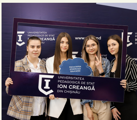
Bun venit, studenților anului I

Simbolurile noi identități instituționale sunt formate din câteva elemente: Monograma Ion Creangă, Scutul, simbol moștenit direct din simbolul heraldic precedent, Cartea deschisă, simbol al cunoștințelor, redată într-o formă stilistică modernă, care subliniază istoria modernă a universității, dar și deschiderea spre modernizarea și adaptarea instituției la noile tendințe din domeniul educației.